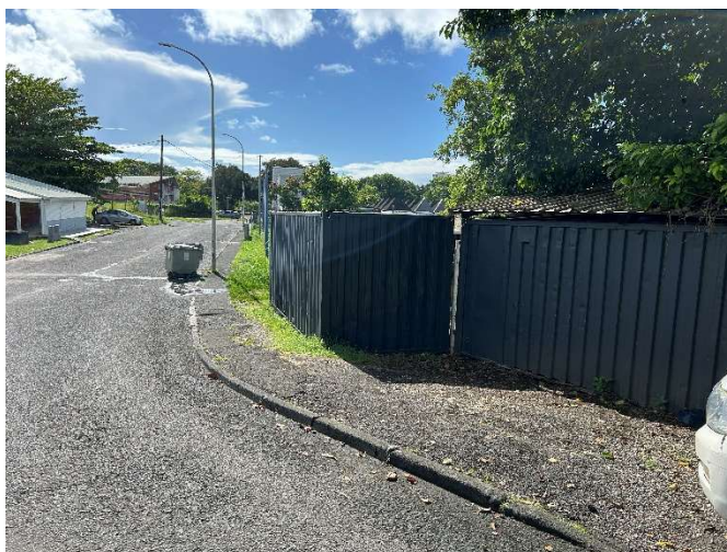
Mise en sens unique – création voie douce sur la route de la Marina