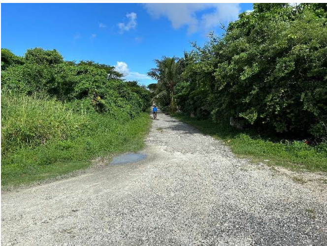
Aménagement piéton – Vélo – Voie pompier à accès limité de la Cocoteraie (depuis Hall des Sports)