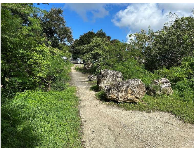
Aménagement piéton – Vélo – Voie pompier à accès limité de la Cocoteraie (depuis Parking aquarium)